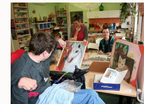
Výtvarný ateliér s keramikou